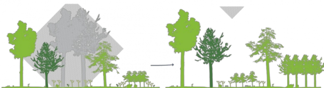
La futaie irrégulière : une coupe réalisée tous les 8 ans environ, pour amener progressivement la forêt vers un mélange équilibré d'arbres de différents âges et tailles.

Des coupes de régénération vont avoir lieu sur les deux parcelles 12 et 21. Elles consistent à récolter les arbres matures pour laisser la place aux jeunes semis, futurs arbres de demain. Elles sont mises en œuvre dans le cadre d'un mode de gestion appelé « sylviculture mélangée à couvert continu » ou « futaie irrégulière ». Les travaux consistent à retirer, à l'intérieur des parcelles, à plusieurs années d'écart, une certaine proportion d'arbres, de façon à conserver un couvert forestier continu, c'est-à-dire que les parcelles ne sont jamais « nues » (sans arbres). Au contraire, l'objectif est qu'elles comportent à terme, une proportion équilibrée de jeunes semis, d'arbres adultes et de vieux arbres.