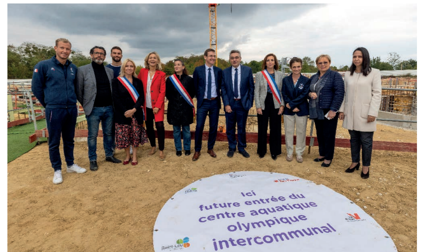
2 / UN TERRITOIRE SÛR ET SOLIDAIRE

Avec des travaux débutés fin 2021, le chantier du futur centre aquatique olympique intercommunal suit normalement son cours avec une livraison programmée début 2024. Le recrutement du futur directeur de l'équipement sportif se fera à la rentrée 2023.