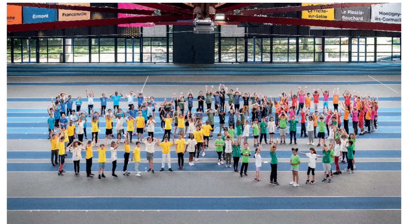
3 / UNE AGGLOMÉRATION EXEMPLAIRE DANS SES PRATIQUES ET ACTIONS

et paralympiques bénéficient à ses habitants et leur laissent un héritage durable en termes d'infrastructures, d'équipement, ou encore d'emplois. À quelques mois de Paris 2024, la communauté d'agglomération a pour objectif d'attirer dès cette année plusieurs équipes ou délégations étrangères dans le cadre de leur phase de préparation avant le grand rendez-vous. L'année 2023 symbolise donc la dernière droite avant les Jeux pour, non seulement faire connaître et valoriser le territoire, mais également faire rayonner le centre aquatique olympique à l'international.