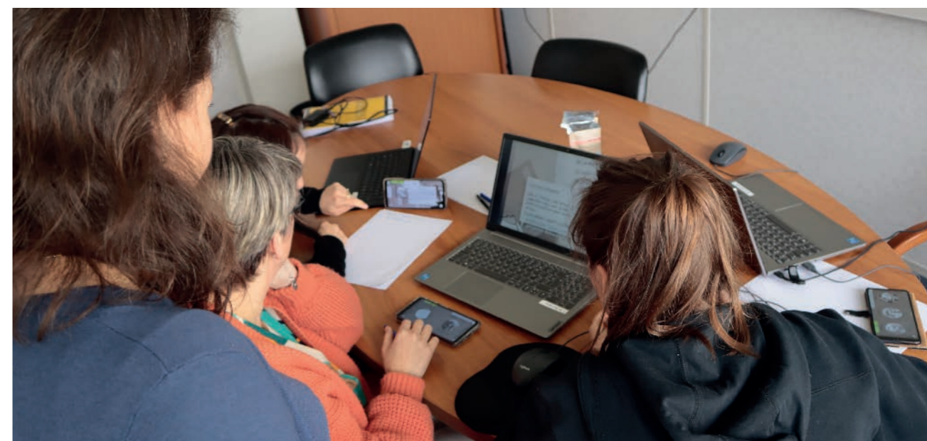
3 / UNE AGGLOMÉRATION EXEMPLAIRE DANS SES PRATIQUES ET ACTIONS

Enfin, un nouveau plan d'action en faveur de l'égalité professionnelle entre les femmes et les hommes devra être construit en 2023 pour la période 2024-2027.