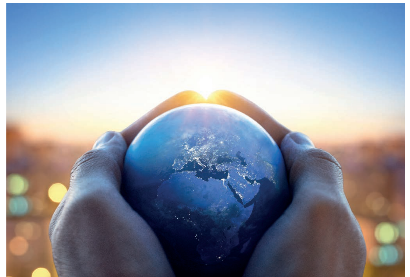
3 / UNE AGGLOMÉRATION EXEMPLAIRE DANS SES PRATIQUES ET ACTIONS

Tout au long du cycle de vie du schéma de mutualisation, les actions qui seront lancées feront l'objet d'une évaluation systématique car, si celle-ci constitue un impératif indiscutable, elle n'en demeure pas moins une opportunité pour améliorer la qualité et l'efficacité de la mutualisation.