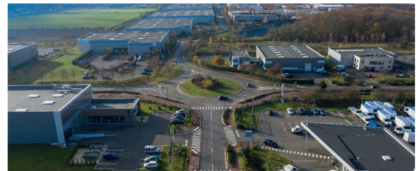
1 / UN TERRITOIRE DYNAMIQUE AU CADRE DE VIE PRÉSERVÉ

Enfin, Val Parisis poursuit son action en faveur des créateurs d'entreprise en proposant un programme d'animation ambitieux au sein de la pépinière d'entreprises, en poursuivant son action d'accompagnement des créateurs dans les quartiers avec le soutien de BPI France et en développant une offre de services accessible et de qualité.