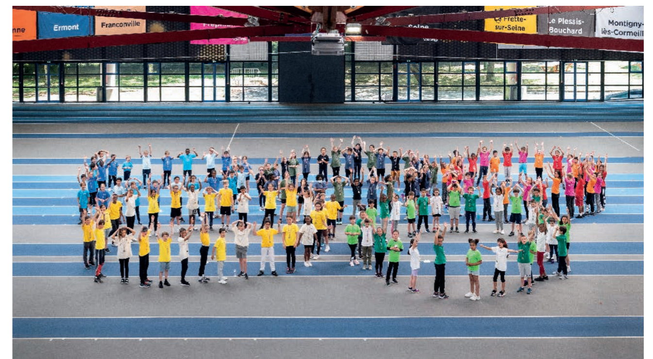
3 / UNE AGGLOMÉRATION EXEMPLAIRE DANS SES PRATIQUES ET ACTIONS

et paralympiques bénéficient à ses habitants et leur laissent un héritage durable en termes d'infrastructures, d'équipement, ou encore d'emplois. À quelques mois de Paris 2024, la communauté d'agglomération a pour objectif d'attirer dès cette année plusieurs équipes ou délégations étrangères dans le cadre de leur phase de préparation avant le grand rendez-vous. L'année 2023 symbolise donc la dernière droite avant les Jeux pour, non seulement faire connaître et valoriser le territoire, mais également faire rayonner le centre aquatique olympique à l'international.