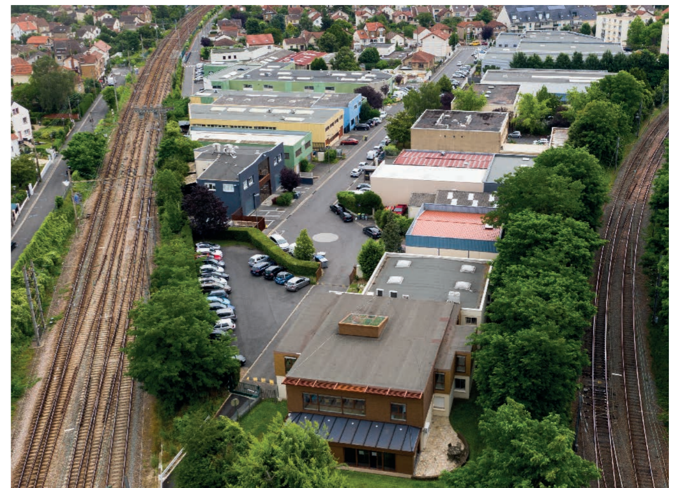
3 / UNE AGGLOMÉRATION EXEMPLAIRE DANS SES PRATIQUES ET ACTIONS

Après avoir constaté des nombreuses dégradations au niveau de la charpente de la médiathèque Maurice-Genevoix à Eaubonne, une réfection complète de la toiture sera effectuée, tout en la rendant plus performante grâce à une isolation de celle-ci. Le chantier devrait être livré courant du mois d'octobre 2023.