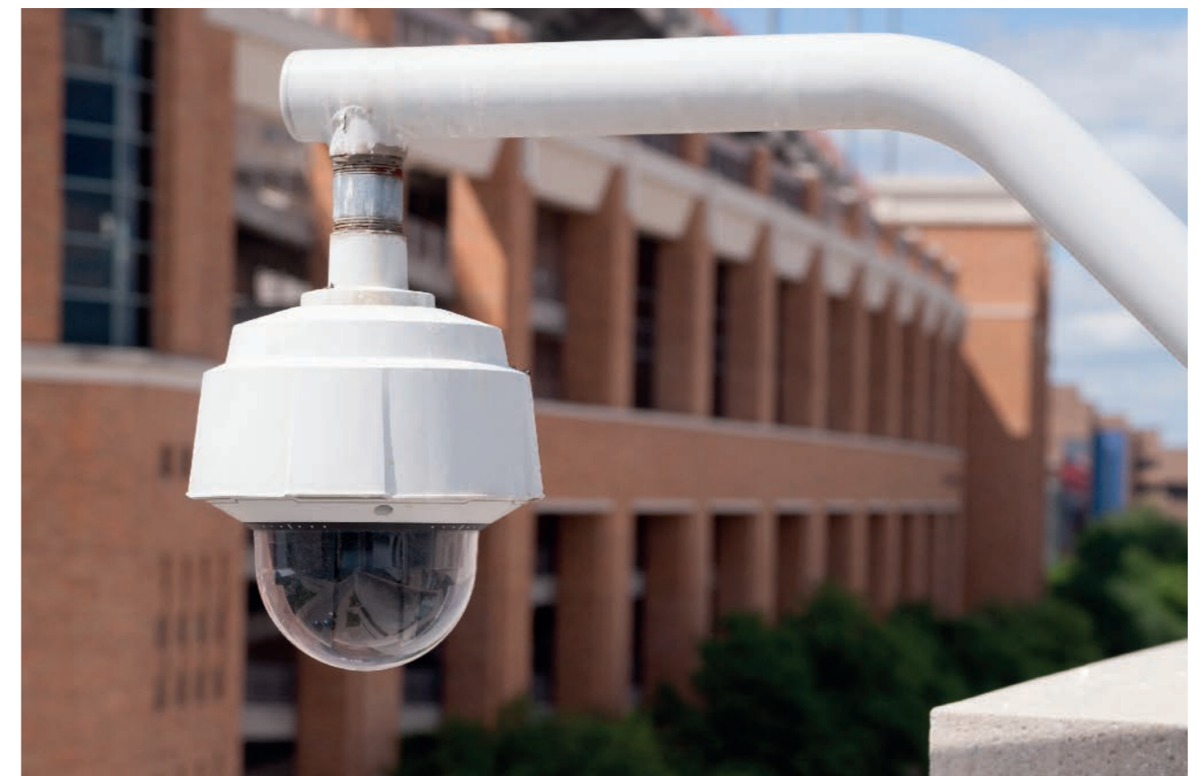
2 / UN TERRITOIRE SÛR ET SOLIDAIRE

Suite la décision d'extinction de l'éclairage public, il a également été décidé de cibler les sites les plus sensibles à vidéoprotéger afin de faire évoluer la technologie existante et de visualiser par infrarouge les périmètres concernés.