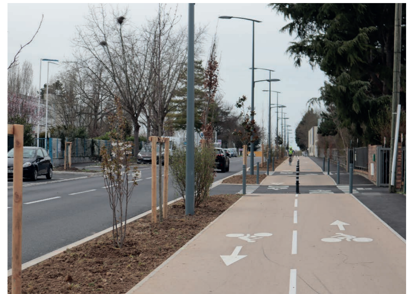
3 / UNE AGGLOMÉRATION EXEMPLAIRE DANS SES PRATIQUES ET ACTIONS

et des équipements intercommunaux, les centres aquatiques et les médiathèques, les travaux d'isolation et rénovation énergétique sur les ateliers locatifs, les études énergétiques en vue du décret tertiaire et les études photovoltaïques pour le développement des panneaux solaires sur le territoire.