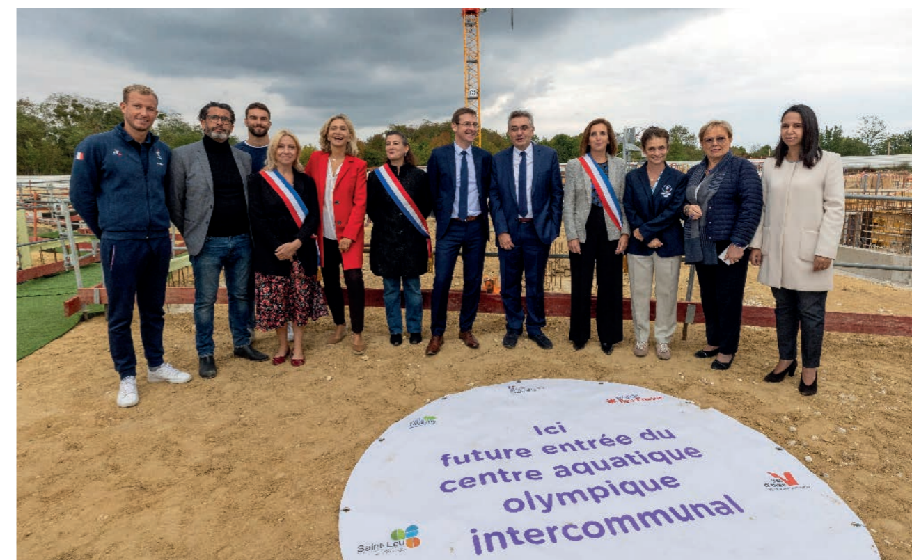
2 / UN TERRITOIRE SÛR ET SOLIDAIRE

Avec des travaux débutés fin 2021, le chantier du futur centre aquatique olympique intercommunal suit normalement son cours avec une livraison programmée début 2024. Le recrutement du futur directeur de l'équipement sportif se fera à la rentrée 2023.