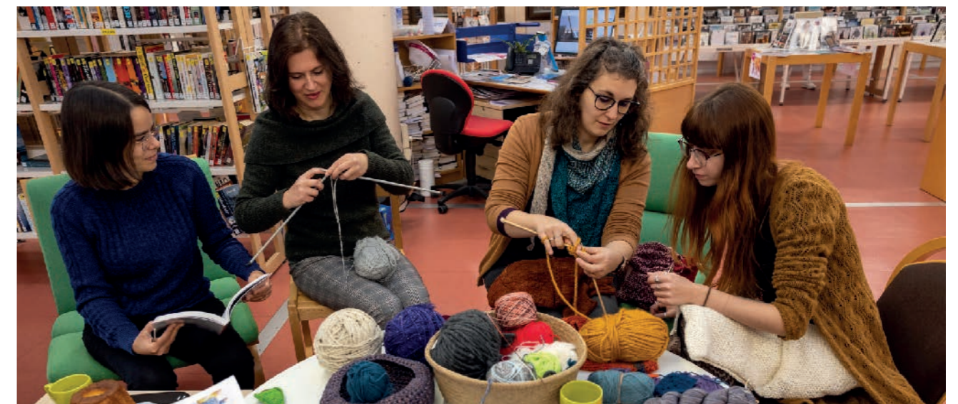
2 / UN TERRITOIRE SÛR ET SOLIDAIRE

Enfin, afin d'améliorer l'utilisation des services en ligne, de faciliter la recherche et l'accès aux informations pour les usagers, le site des médiathèques va être modernisé cette année.